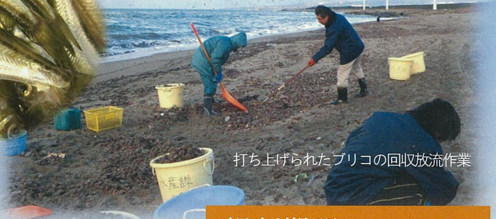
打ち上げられたブリコの回収放流作業